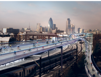
SkyCycle, London © Foster + Partners and Exterior Architecture

FILMREIHE «Die Drahtesel sind los» Querfeldein durch die Filmlandschaft 1. April bis 14. Mai In Zusammenarbeit mit dem Kino Cameo, Lagerplatz 19, Winterthur. Detailprogramm folgt. Spielplan und Reservation www.kinocameo.ch