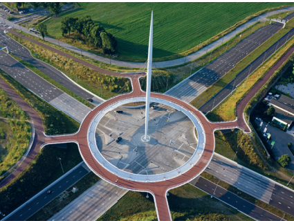
Radbrücke Hovenring in Eindhoven, Niederlande