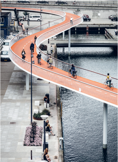
Cykelslangen in Kopenhagen © Dissing + Weitling Architecture, Foto: Rasmus Hjortshøj

FESTIVAL Urban Bike Festival 2017 Freitag, 7. bis Sonntag, 9. April Schiffbau und Turbinenplatz, Zürich Das Gewerbemuseum ist Gast des Festivals. Die Kreation, die die Fachjury des 9. «Bike Lovers Contest» überzeugt, wird vom 11. bis 30. April im Gewerbemuseum ausgestellt.