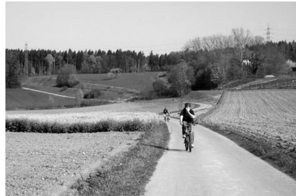
Winterthur nordwärts auf ruhigen Wegen.

10 Kilometer die rasante Fahrt schnurgrade auf dem Thurdam – wenn zwei auf einem Velo strampeln, geht es eben wirklich fast doppelt so schnell. Obwohl völlig im Geschwindigkeitsrausch (was an diesem Tag dank sehr geringem Velo- und Fussgängeraufkommen kein Problem ist), verzichten wir doch nicht auf