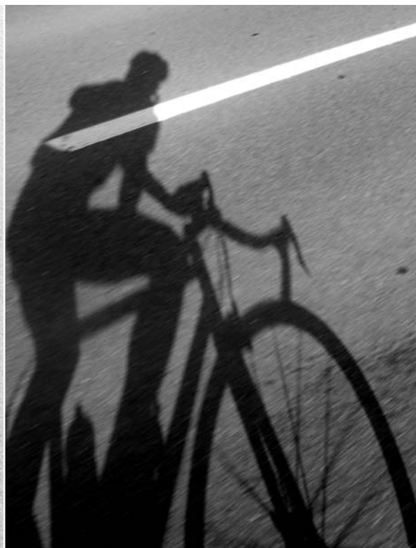
Schattenwurf im Hochsommer.

Papier vermuten lässt. Grenzen sind überall; Übergänge sind fließend und darum auch im kleinen Kaff auf dem Lande offensichtlich.