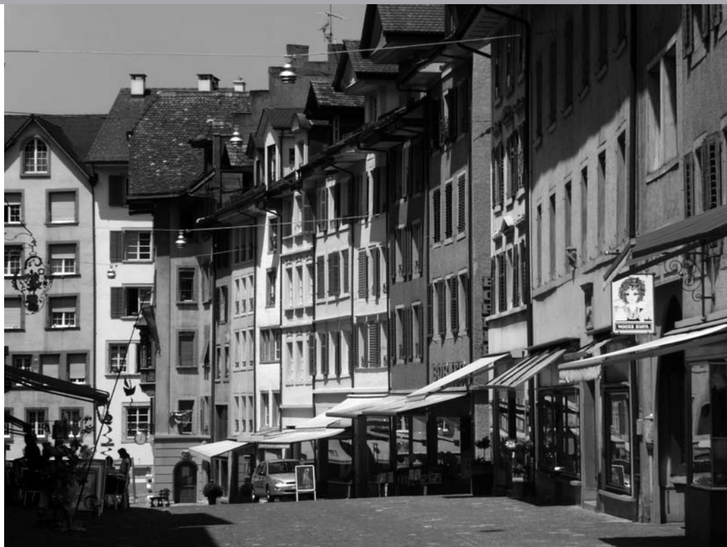
Bremgartens Altstadt ist autofrei aber für Velos erlaubt. Ausserdem ist sie sehr schön.

Ach ja: die Kantonsgrenze (auf dem Litzibuch). Die verpasst man gewiss – und merkt alsbald, dass der ach so freie zwinglianische Geist Zürichs auch in seiner Heimatstadt grosser Kirchenreformatoren nicht mehr allgegenwärtig sein kann. Denn was daran erinnert, im Aargau auf Velofahrt zu sein, sind nebst auffallend eleganter, spitzer und formstren-