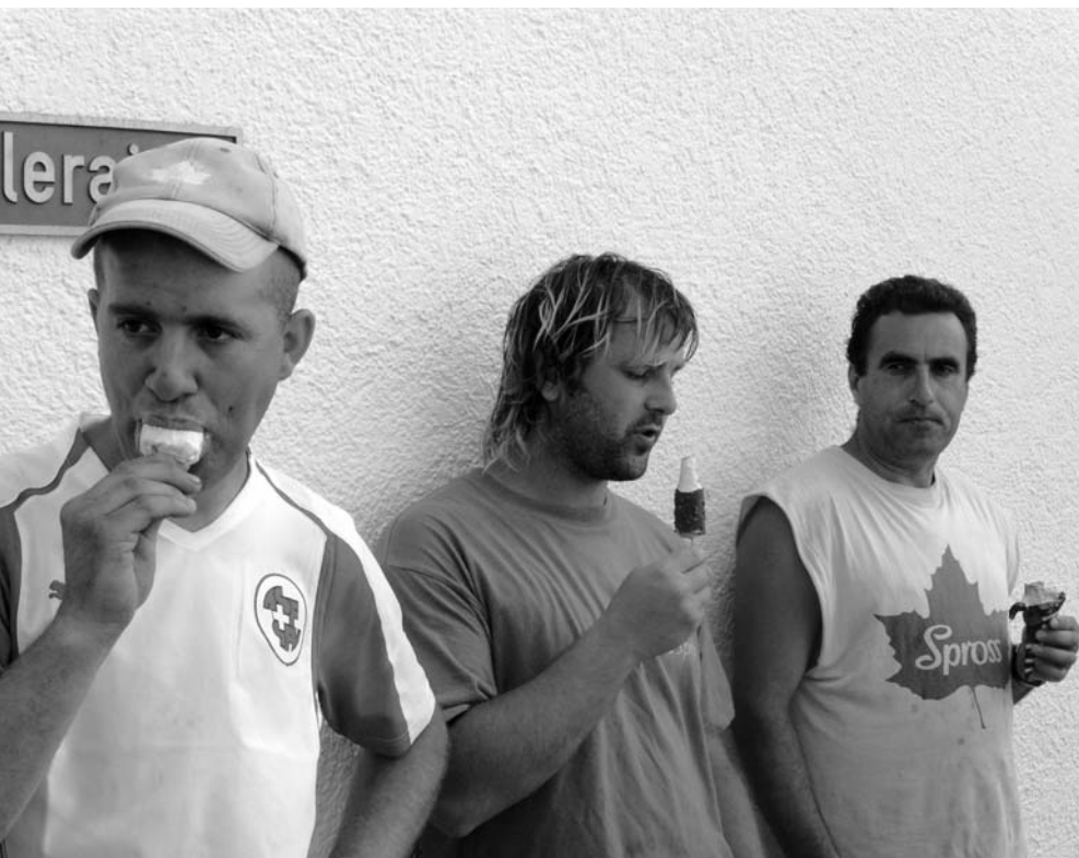
Zwinglianischer Arbeitsgeist im Aargau? Schnell werden lokale Sitten übernommen.

Wer meint, durch den Aargau könne man nur mit dem Zug oder dem Auto brausen, täuscht sich gewaltig. Der Rüblikanton bietet viele Möglichkeiten für wunderschöne Velotouren. Eine davon, eher sportlicher Natur, führt von Birmensdorf durchs Reusstal nach Birmenstorf und durchs Limmattal wieder zurück.