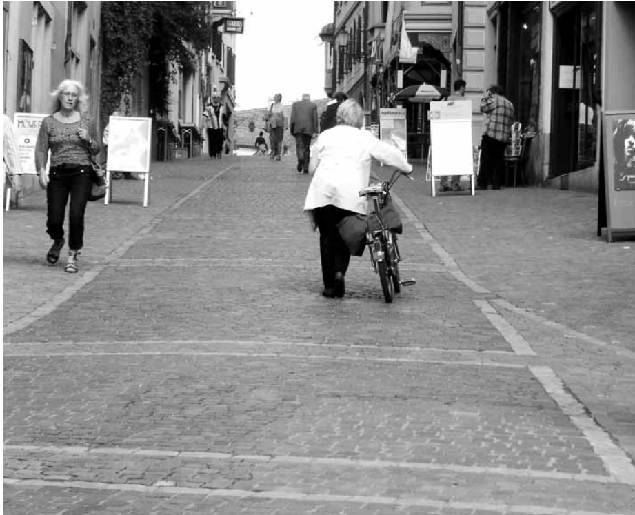
Sie muss bald nicht mehr schieben, sondern darf legal durch die Kirchgasse fahren.

als gegen diesen Entscheid eine Einsprache einzureichen. Der Rechtsstreit rund um diese Einsprache dauerte fast auf den Tag genau zehn Jahre, bis im Frühling 2006.