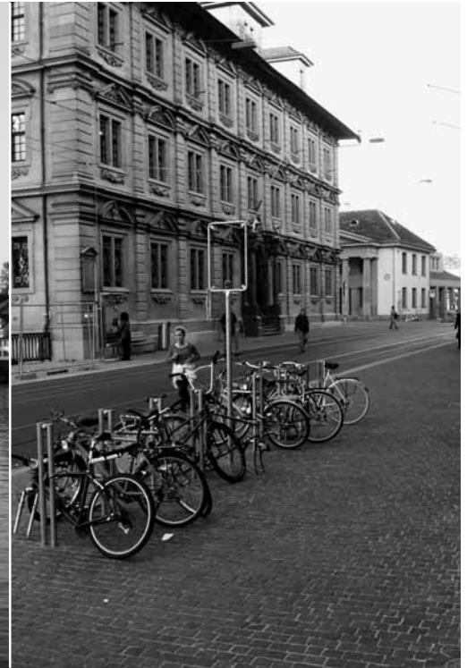
Neue Veloständer am neuen Limmatquai.

Der Veloverkehr in der Innenstadt ist eine Leidensgeschichte für die Velofahrenden, für die Zufussgehenden und für alle, die Lösungen im Geiste der Koexistenz der Verkehrsteilnehmenden anstreben. Der Autor kann ein Lied davon singen. Ein Lied? Ach was, einen ganzen Liederabend bestreiten. Das Thema zog sich wie ein roter Faden durch die zehn Jahre als Präsident der IG Velo Kanton Zürich, ohne dass eine velofreundliche Lösung in Sicht schien. Heute können vorsichtige Optimisten einen Lösungsweg am Horizont erkennen.