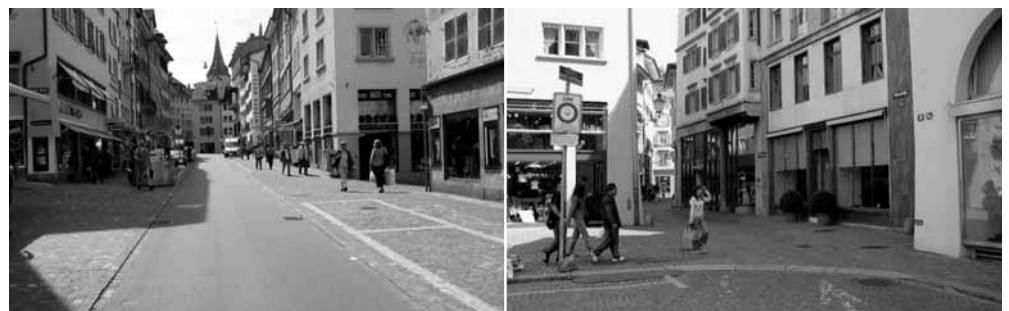
Rennweg und Storchengasse: Öffnung fürs Velo wurde durch einen Rekurs blockiert.

sollte der Veloverkehr flächendeckend erlaubt sein. Neukomm ignoriert nicht nur seine Fachleute und die positiven Erfahrungen von velodurchlässigen Fussgängerbereichen im In- und Ausland. Er setzte sich damit auch über den Auftrag des Gemeinderates hinweg. Man muss sich die damalige Situation für den Veloverkehr in der Innenstadt vergegenwärtigen: keinerlei Velomassnahmen an den Knoten Central, Bellevue, Bahnhof und Bürkliplatz, gefährliche Hauptachsen wie Seilergraben, Rämistrasse, Talstrasse, Uraniastrasse, und nun sollte mit dieser Verfügung auch noch die Altstadt zur velofreien Zone werden. Das Velo drohte aus der Innenstadt verbannt zu werden. Die IG Velo Kanton Zürich konnte gar nicht anders,