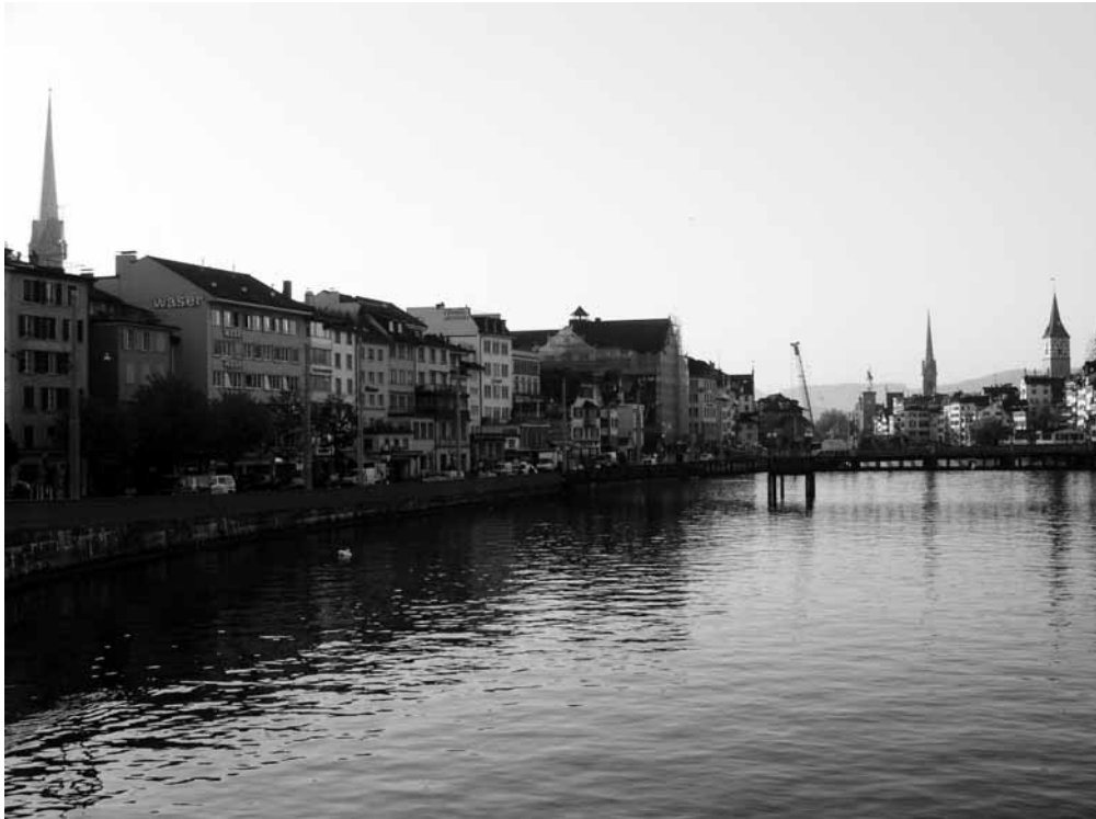
Zürchs Innenstadt wird schon in naher Zukunft velodurchlässig sein.

Mit der Eröffnung des umgebauten Limmatquais im Dezember tritt der Veloverkehr in der Zürcher Innenstadt in eine neue Ära: Die Velofahrenden erhalten ein Netz von sicheren Verbindungen. Das ist nicht nur, aber vor allem das Verdienst der IG Velo Kanton Zürich.